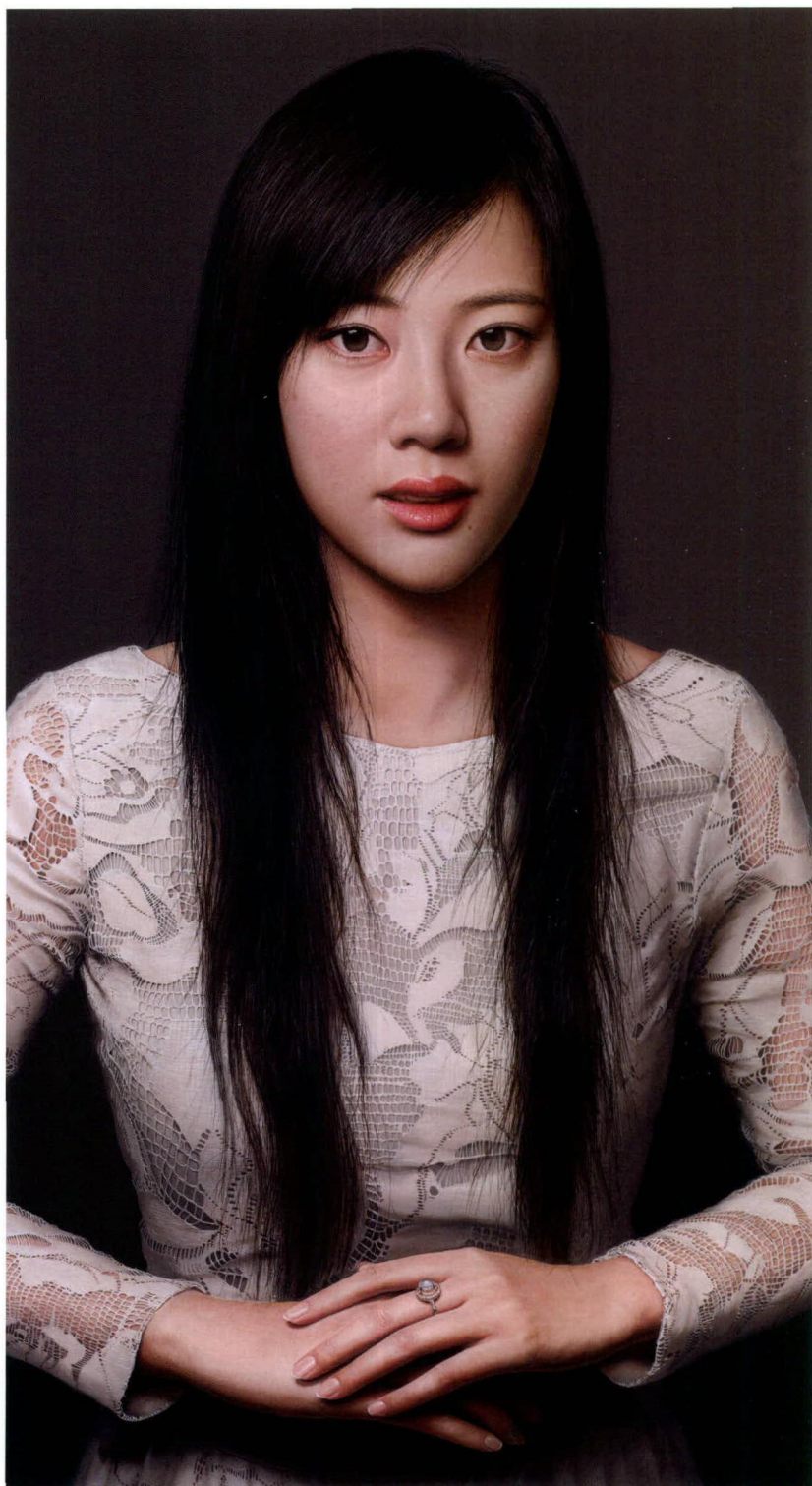
周松 珊珊(局部) 布面油彩 120×50厘米 2012年

周松的作品关注当下，现实的真实与内心真实或者是人格真实的叠加，在交叉中呈现出写实绘画中关于艺术的真实，也为他带来用之不竭的创作灵感。作为一位年轻的当代艺术家，他对现实世界始终保持独立而冷静的思考，他用超具象的语言手段自由地表达，不需要所谓的“符号”来强化艺术风格。他用年轻人特有的敏感和激情创作，在真实的生活继续“造梦”。