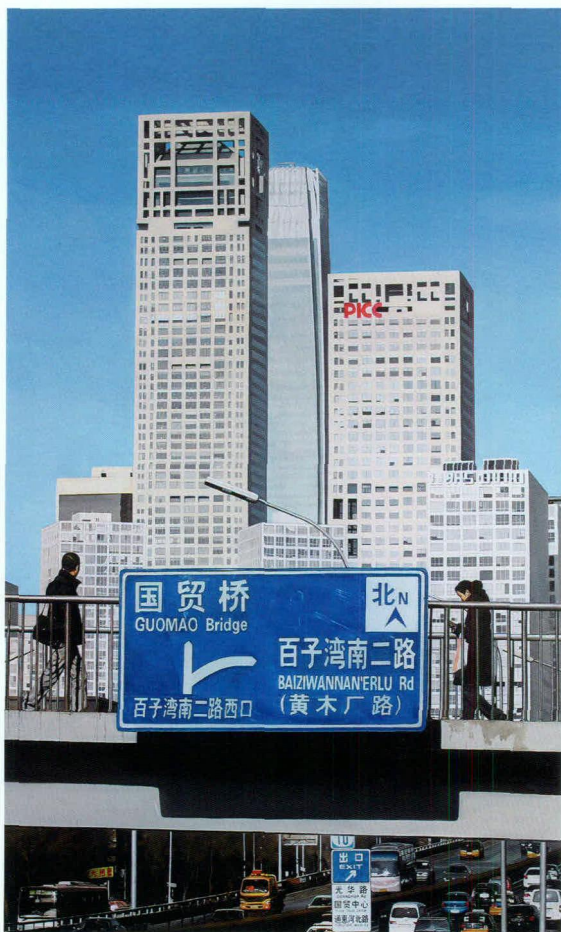
周松 北京时间 布面油彩 135×85厘米 2010年

周松 1982年出生于江西，2006年毕业于天津美术学院。2003年开始用超写实技法进行油画创作，2006年作品获得毕业创作一等奖、全国美术院校毕业生作品提名展油画铜奖，同年成为今日美术馆签约画家。2006年至今在北京一直从事油画创作，作品深受美术馆、画廊、机构、评论家及收藏家的关注，2009年在今日美术馆成功举办个人画展，2012年获第五届“五四国际青年艺术节”绘画大奖。多幅作品被今日美术馆、成都现代艺术馆、天津美术学院、海内外收藏家、艺术机构、画廊收藏。