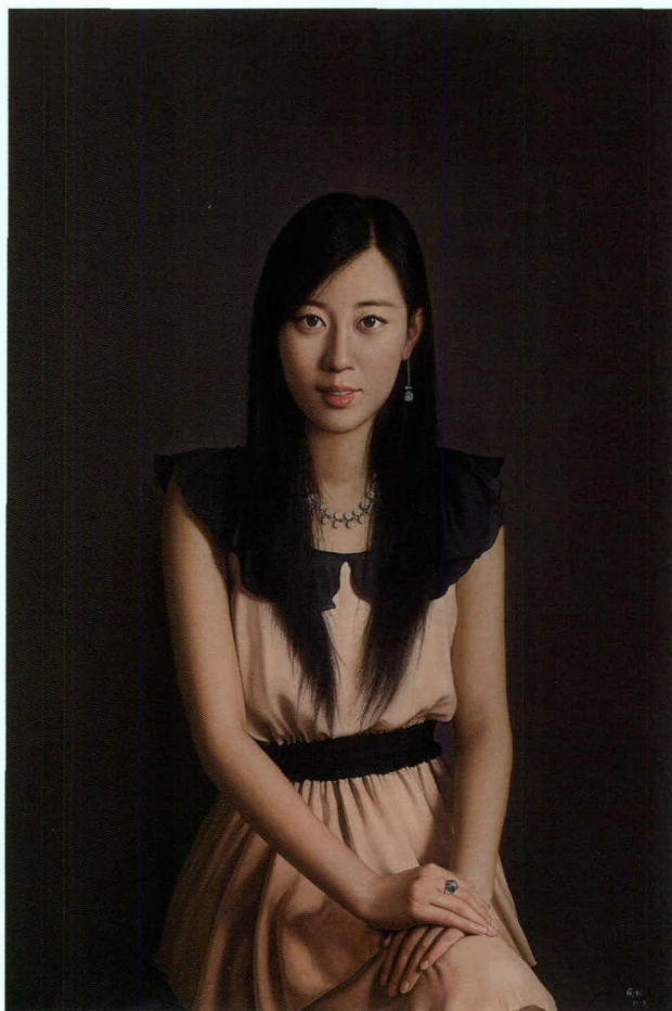
周松 青春 布面油彩 106×73厘米 2012年